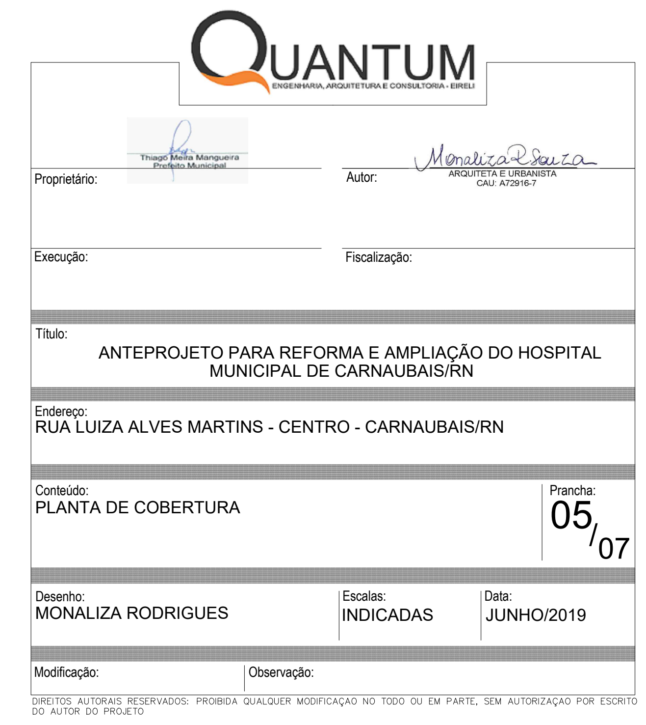
PLANTA DE COBERTURA Hospital Maternidade Santa Luzia - Carnaubais /RN Escala 1/75

ESTRUTURA METÁLICA COM REVESTIMENTO EM ACM CINZA ESCURO, SACANDO 40CM EM RELAÇÃO A PAREDE EXISTENTE